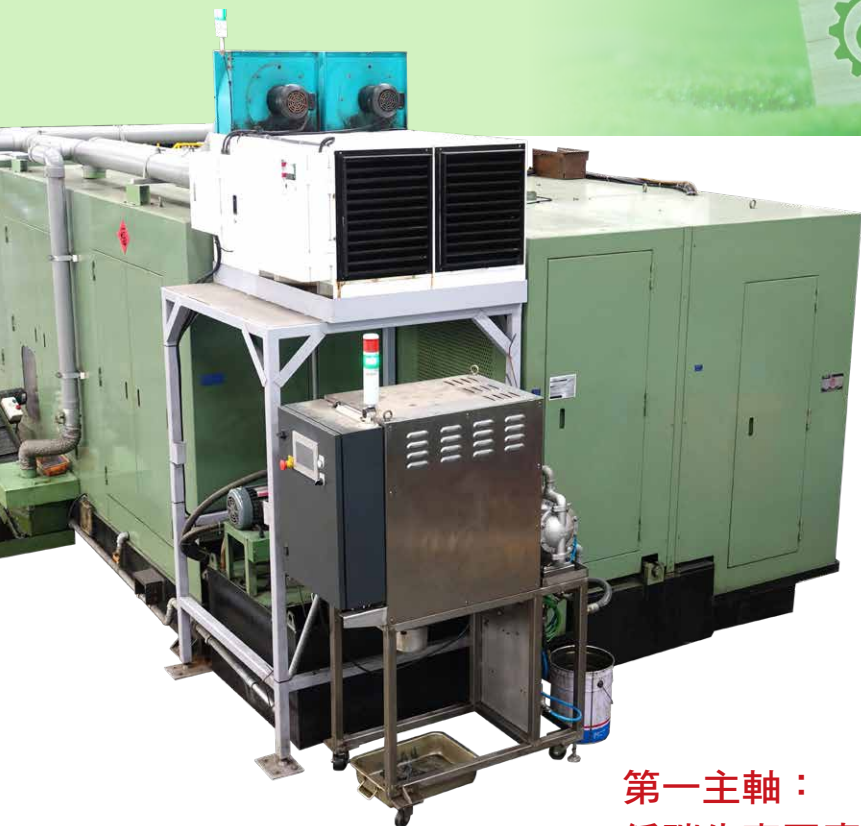
採用低碳化生產設備