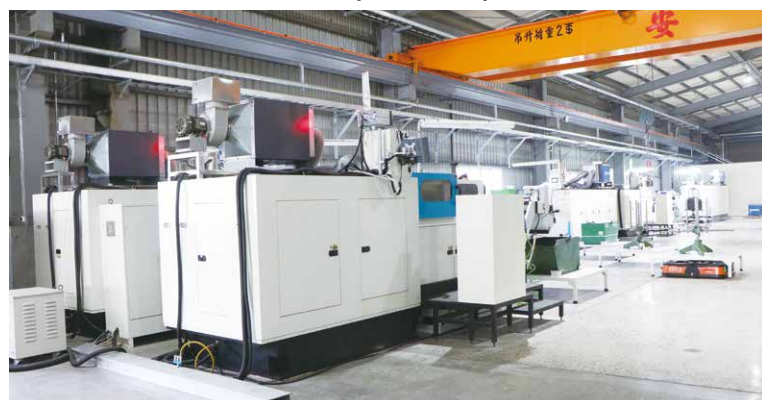
AI 智慧設備規劃整合