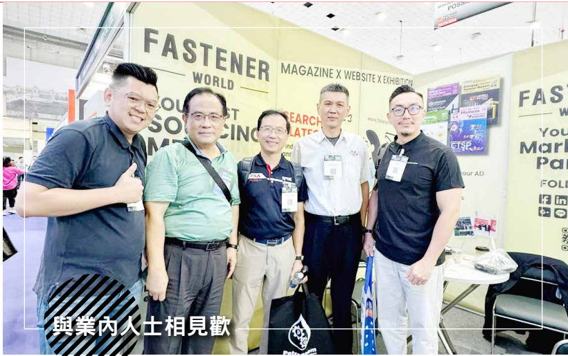
與業內人士相見歡